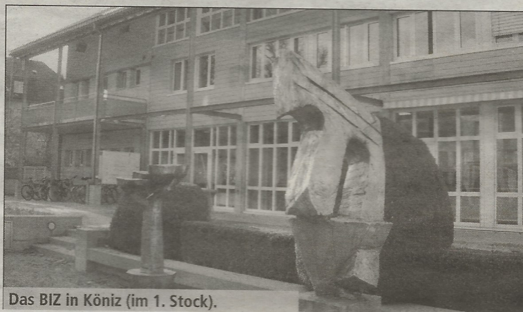
Das BIZ in Köniz (im 1. Stock).

regionalen Berufsbera- tungs- und Informations- zentren werden Ende Juli geschlossen. Darun- ter auch Schwarzenburg Köniz. Wer sich nach dem Datum beraten lassen will, muss sich nach Bern bemühen – oder sich dezentraler mit einem Beratungsgespräch begnügen.